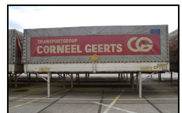
Wechselbehälter auf Füßen