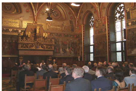
Empfang im Rathaus

Die Herbst-Generalversammlung der UIRR hat am 23. und 24. September 2004 in Brügge stattgefunden. Gegenstand dieser Versammlung war in erster Linie das wichtige Thema der Qualität des Schienengüterverkehrs. Es ging auch um die intermodalen Ladeeinheiten, um die für den KV zur Verfügung stehenden Kapazitäten sowie um die Sicherheit im KV.