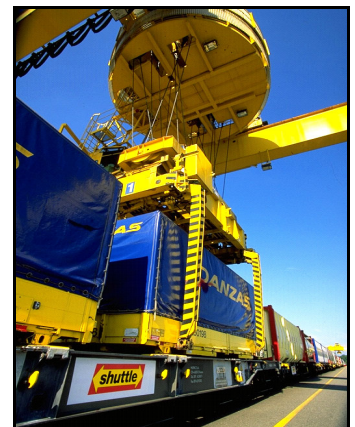
Wechselbehälter (von unten kranbar)

Die UIRR hofft, dass Änderungen von Ministerrat und Europaparlament die Normung eines Eurocontainers vortreiben, ohne die Verwendung und den Bau neuer Wechselbehälter einzuschränken, die schließlich aufgrund der CEN Normen hinreichend kompatibel, d.h. „kombifähig“ sind.