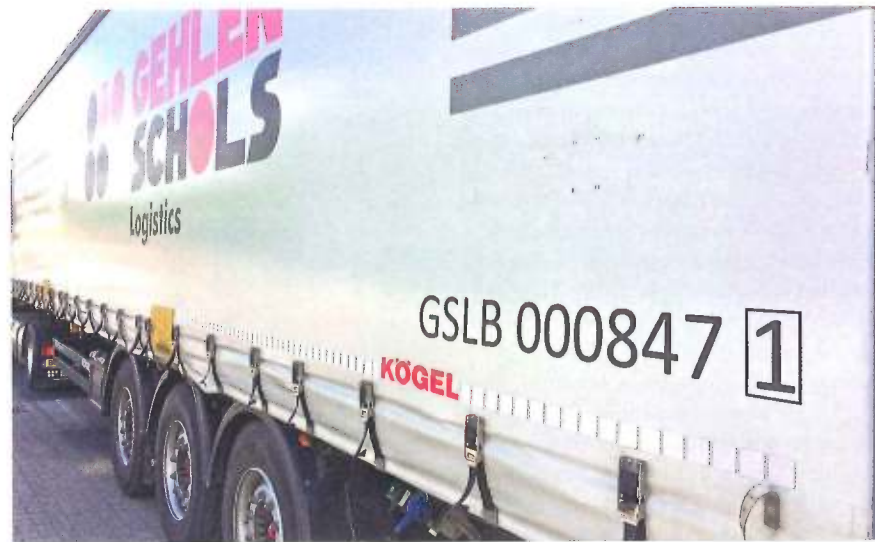
Wer im KV unterwegs ist, sollte ab dem 1. Juli über einen ILU-Code an der Ladeeinheit verfügen