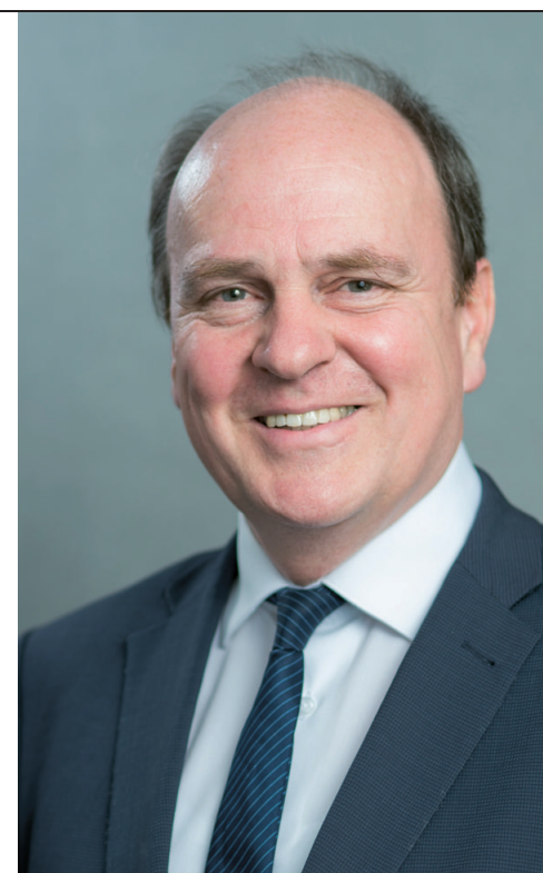
Ralf-Charley Schultze vertritt als Präsident die Internationale Vereinigung für den Kombinierten Verkehr Schiene-Straße (UIRR) in Brüssel.

„In den EU-Mitgliedstaaten gibt es, historisch gewachsen, unterschiedliche Stromsysteme, Signalsysteme und Sicherheitssysteme, teilweise sogar andere Spurbreiten – aber das alles kann gelöst werden“, ist der UIRR-Präsident überzeugt. In puncto Interoperabilität mache die EU, unterstützt durch digitale Lösungen, „riesige Fortschritte“. Aber die Infrastruktur und die Energieversorgung stellen den kombinierten Verkehr vor bedeutende Probleme. „Das Netz ist problematisch, weil 30 Jahre lang kaum in die Infrastruktur investiert wurde und man nun alles auf einmal machen will.“ Das führe dazu, dass bestimmte Linien blockiert würden und Züge stehenbleiben müssten. „Die Schiene ist wettbewerbsfähig, wenn sie Pünktlichkeit gewährleisten kann“, erklärt Schultze. Derzeit